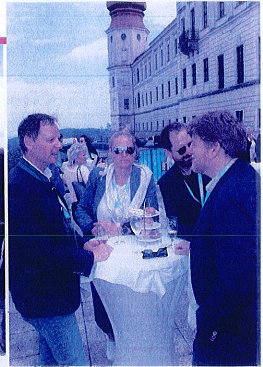
Kaufleute vor dem Stift Göttweig

Und immer noch kämpft ein tapferes Heer von 600 Kaufleuten unter Flagge der Nah&Frisch in ganz Österreich. 300 davon sind zum großen Sommer-Meeting auf Stift Göttweig gekommen. Die Frage lautete: Was bringt die Zukunft, wo geht die Reise hin?